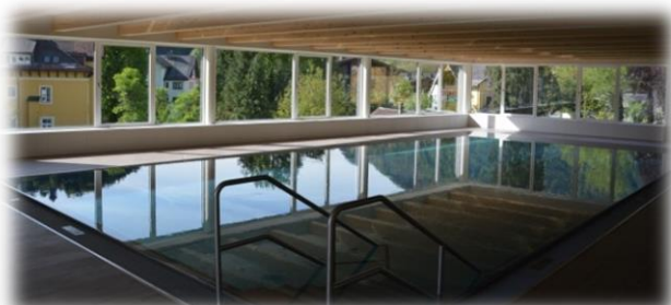
Das neue Therapiebecken mit Aussicht

In Zukunft wird auch ein Hauptaugenmerk auf den Lipidstoffwechsel gelegt.