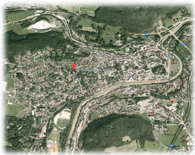
Lage der HerzReha – Im Zentrum von Bad Ischl