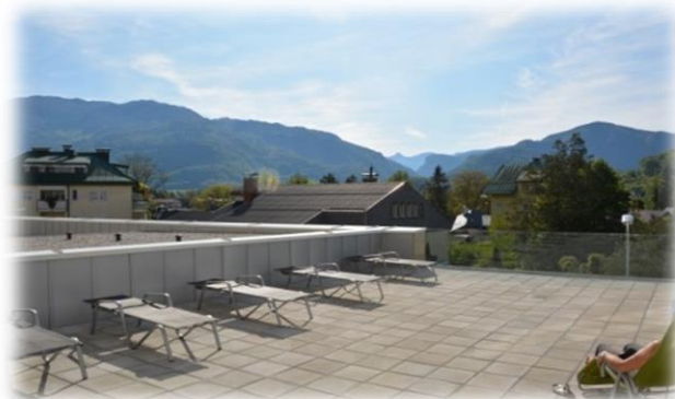
Blick von der Patiententerasse

Bis voraussichtlich Ende 2016 wird die HerzReha Bad Ischl generalsaniert und erweitert, was zu leichten Einschränkungen für die Patientinnen und Patienten führen kann. Nach Fertigstellung der zweiten Bauetappe konnte Anfang Mai der erste Zubau mit dem neuen Hallenbad, Sauna und Turnsaal der Bestimmung übergeben werden.