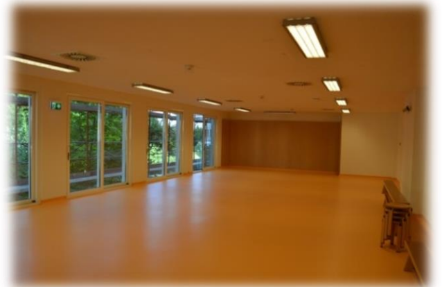
Der neu errichtete Turnsaal

Auch im Haus werden für die Patienten regelmäßig Veranstaltungen angeboten.