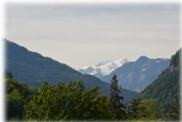
Blick zum Dachstein vom Zimmer aus

Gerne stehen unsere Kolleginnen und Kollegen für Fragen zur Reha in Bad Ischl zur Verfügung. Sämtliche Kontaktdaten finden Sie auch in dieser Information.