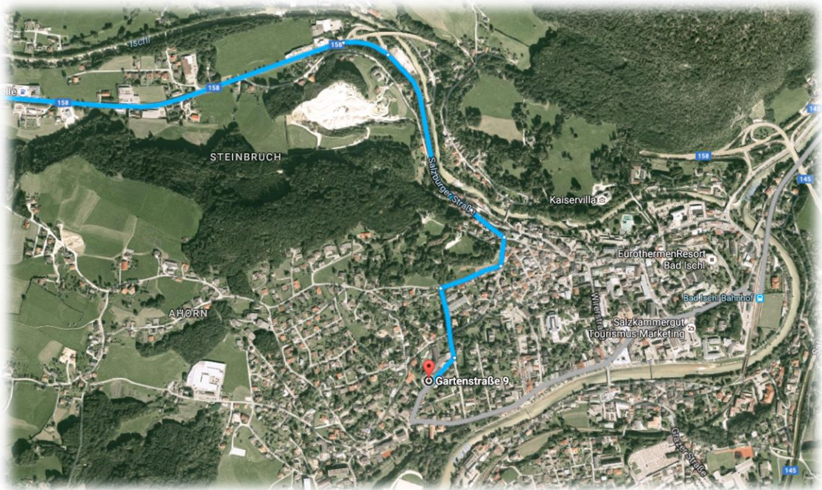
Gesamtansicht der Anreise-Route

Folgen Sie der B158 durch die Ortschaft Pfandl bis zur Shell-Tankstelle auf der linken Seite. Hier biegen Sie rechts Richtung Bad Ischl ab.