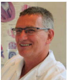
Sehr geehrte Ärztinnen und Ärzte,

mit unserem neuen Newsletter „Ordination und Reha“ wollen wir Sie regelmäßig über die medizinischen und therapeutischen Angebote unseres Hauses informieren.