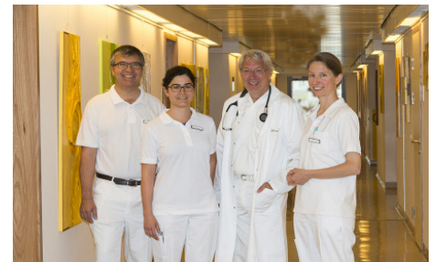
Team der HerzReha

Die HerzReha Bad Ischl – mitten im schönen Salzkammergut – ist eine etablierte, auf Herz-Kreislauf-Erkrankungen spezialisierte Gesundheitseinrichtung.